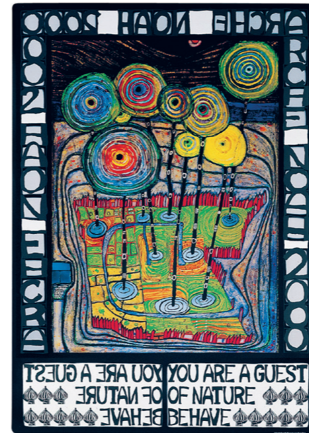
Abbildungsnachweis von links nach rechts: Friedensreich Hundertwasser, 1985 © Archiv Hundertwasser 2024, Gerhard Krömer; Friedensreich Hundertwasser, 433 DAS ICH WEISS ES NOCH NICHT, 1960 © 2024 Namida AG, Glarus, Schweiz; Friedensreich Hundertwasser, ARCHE NOAH 2000 - YOU ARE A GUEST OF NATURE - BEHAVE, Originalposter, 1981 © 2024 Namida AG, Glarus, Schweiz; Fassade des KunstHausWien mit „Baummietern“ © Paul Bauer

The contemporary art program of KunstHausWien focuses on positions of national and international, young and established artists who address issues critical to our future. The complex relationship between man and nature, the climate crisis, and the ecological challenges it entails are explored in exhibitions, educational formats, and outreach programs. In so doing, the museum stays true to the principles of its founder: "We regard the future as a joint creative endeavor, and art as a mission to take on sociopolitical responsibility."