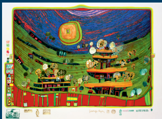
699A Die Häuser hängen unter den Wiesen, Lengmoos 1971/1972